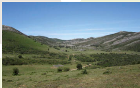
Cruz de Urria y Vicenturo (J. Gordo Llorián)

Para volver al punto de inicio, se ha de regresar al cruce y descender por la derecha, por un camino empedrado que se transforma en pista alcanzando Taxa, donde se puede visitar la Iglesia de San Emiliano, con su retablo barroco. Desde Taxa solo resta regresar con precaución por la carretera TE-3 hasta Urria.