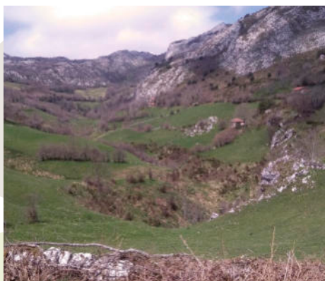
Puerto de Marabio (J. Gordo Llorián)

Tras caminar medio kilómetro, el camino cruza la carretera y continúa hasta pasar el abrevadero de Reboiro, donde se ha de girar a la izquierda, ascendiendo por praderías hasta la Braña de La Monxal, entroncando con la carretera que conduce a Vil.lamayor. Al alcanzar el Alto de Santiago, vale la pena acercarse a la Capilla de Santa Cristina, junto a la que hay restos de un dolmen. Continúando por esta carretera se enlaza con la que viene de Villabre y ya no se ha de abandonar hasta llegar al punto de inicio.